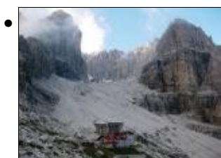
Tappa 6. Cima d'Ambiez e Cima Garbari sovrastano il Rifugio Agostini