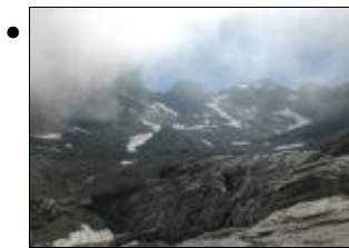
Tappa 6. L'inconfondibile Bocca dei Due Denti