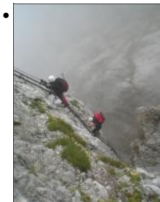
Tappa 6. Le nebbie che salgono dal Lago di Molveno sulla Ferrata Castiglioni