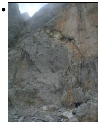
Tappa 6. La base della Ferrata Castiglioni