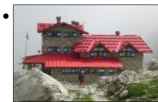
Tappa 6. Il Rifugio Agostini