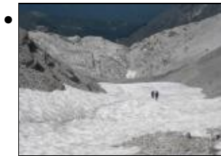
Tappa 6. Salendo dal Rifugio XII Apostoli verso la Bocca dei Due Denti