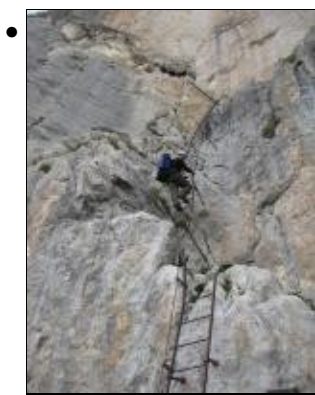
Tappa 6. La Ferrata Castiglioni