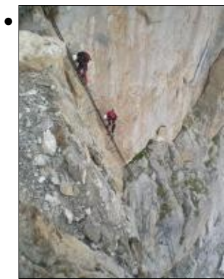
Tappa 6. Ultime scale della Ferrata Castiglioni