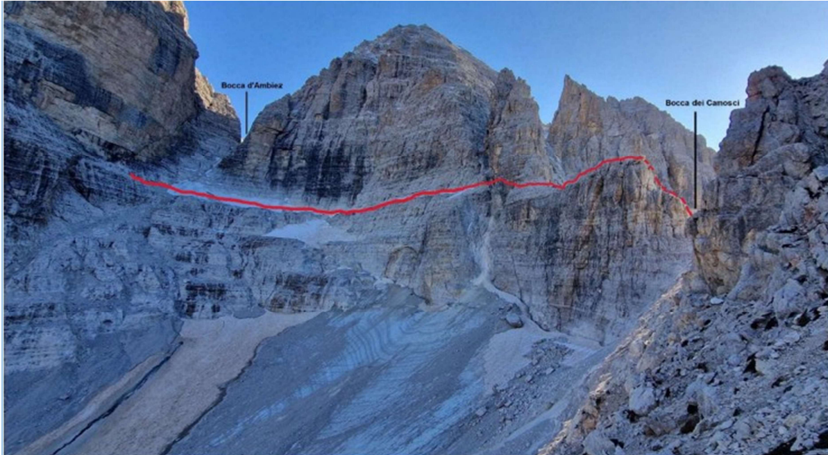
Panoramica nuovo tratto attrezzato